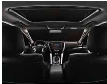
Techo Solar. (Versión Top)