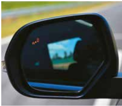
Sistema de Advertencia de punto ciego (BSW). (Versión Top)

Desde asientos de cuero con suaves fruncidos y doble capa de amortiguación hasta una gran amplitud para el relajamiento y una posición de conducción optimizada, mantiene a todo el mundo cómodo y en la mejor de las disposiciones.