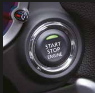
Interruptor del motor

Al transportar la llave, podrá pulsar un botón en el exterior de las puertas delanteras o del portón trasero para bloquear o desbloquear todas las puertas y el portón trasero, y pulsar el interruptor del motor en la cabina para arrancar o parar el motor.